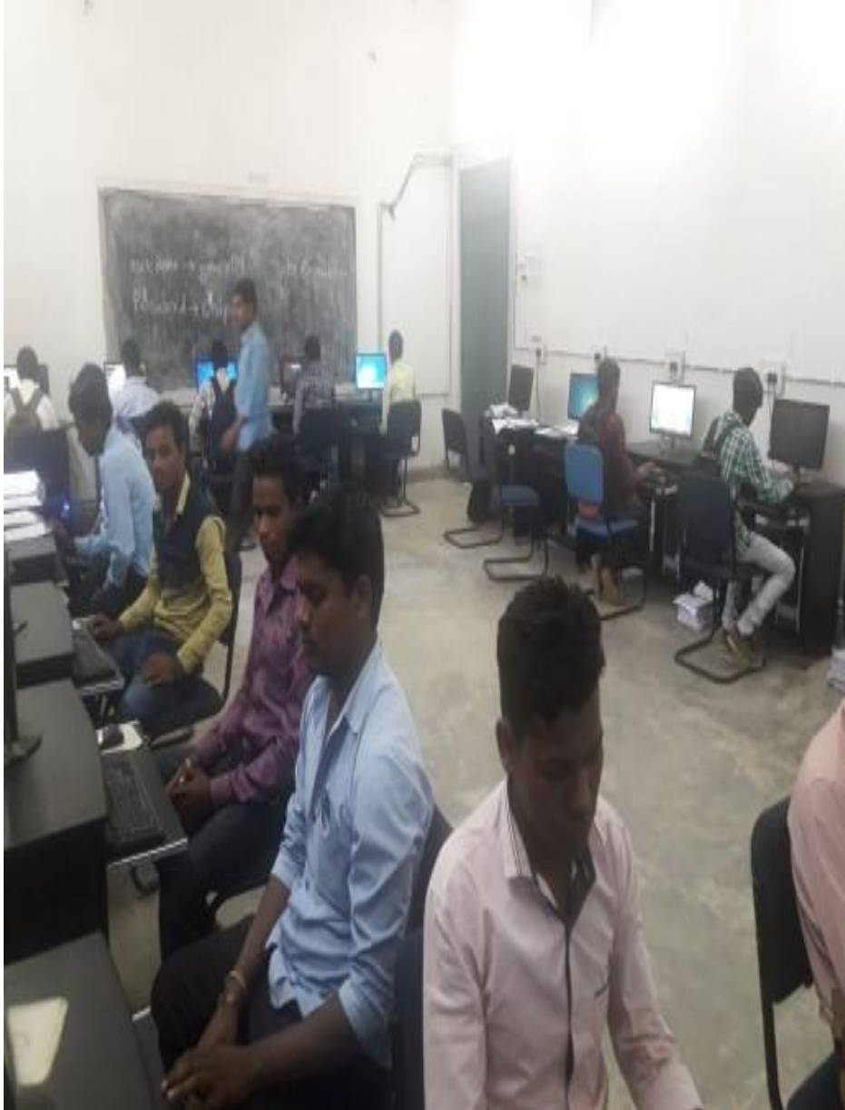
Users of Free ICT Facilities at NRC