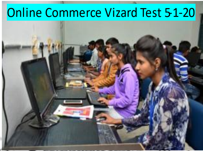
Online Commerce Vizard Test 5-1-20