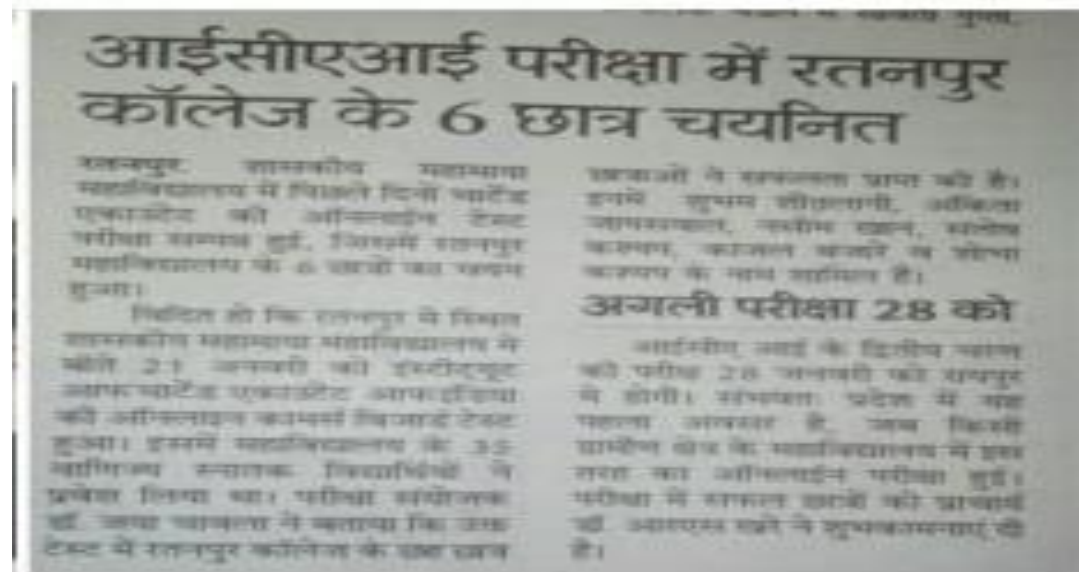
Online Commerce Vizard Test 22-1-18