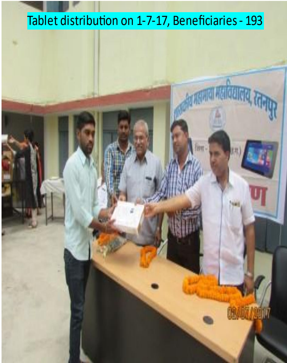
Tablet distribution on 1-7-17, Beneficiaries - 193